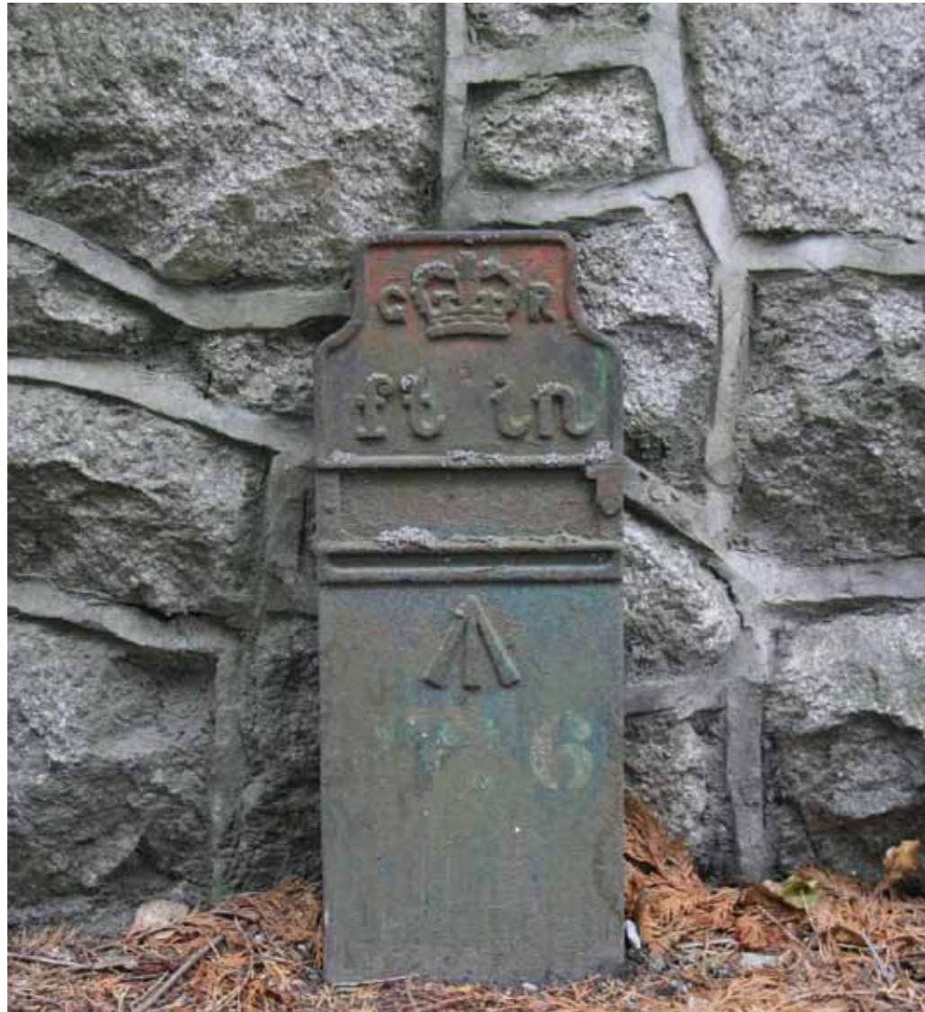
Marc cáblaí teileafóin ar Bhóthar Torquay, Carraig an tSionnaigh. Níl ach dhá cheann den chineál seo fágtha sa Chontae agus bhain sé seo leis an tréimhse 1911-1921.