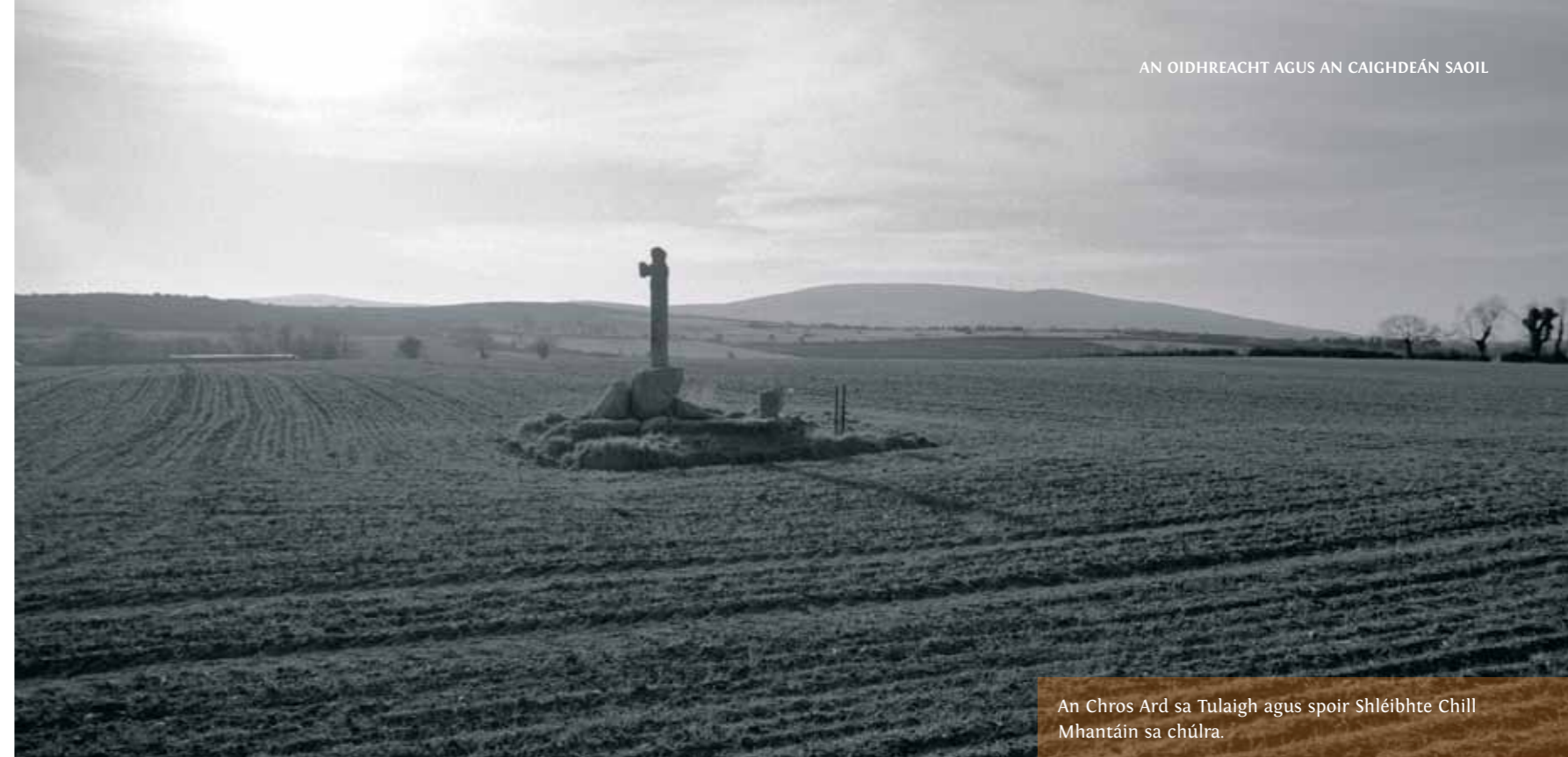
An Chros Ard sa Tulaigh agus spoir Shléibhte Chill Mhantáin sa chúla.

Cé nach gá go ndéanfaí brabús go díreach as an oidhrecht agus cúrsaí eacnamaíochta mar atá faoi láthair ní mór go dtuigfí an tábhacht eacnamaíoch a ghabhann