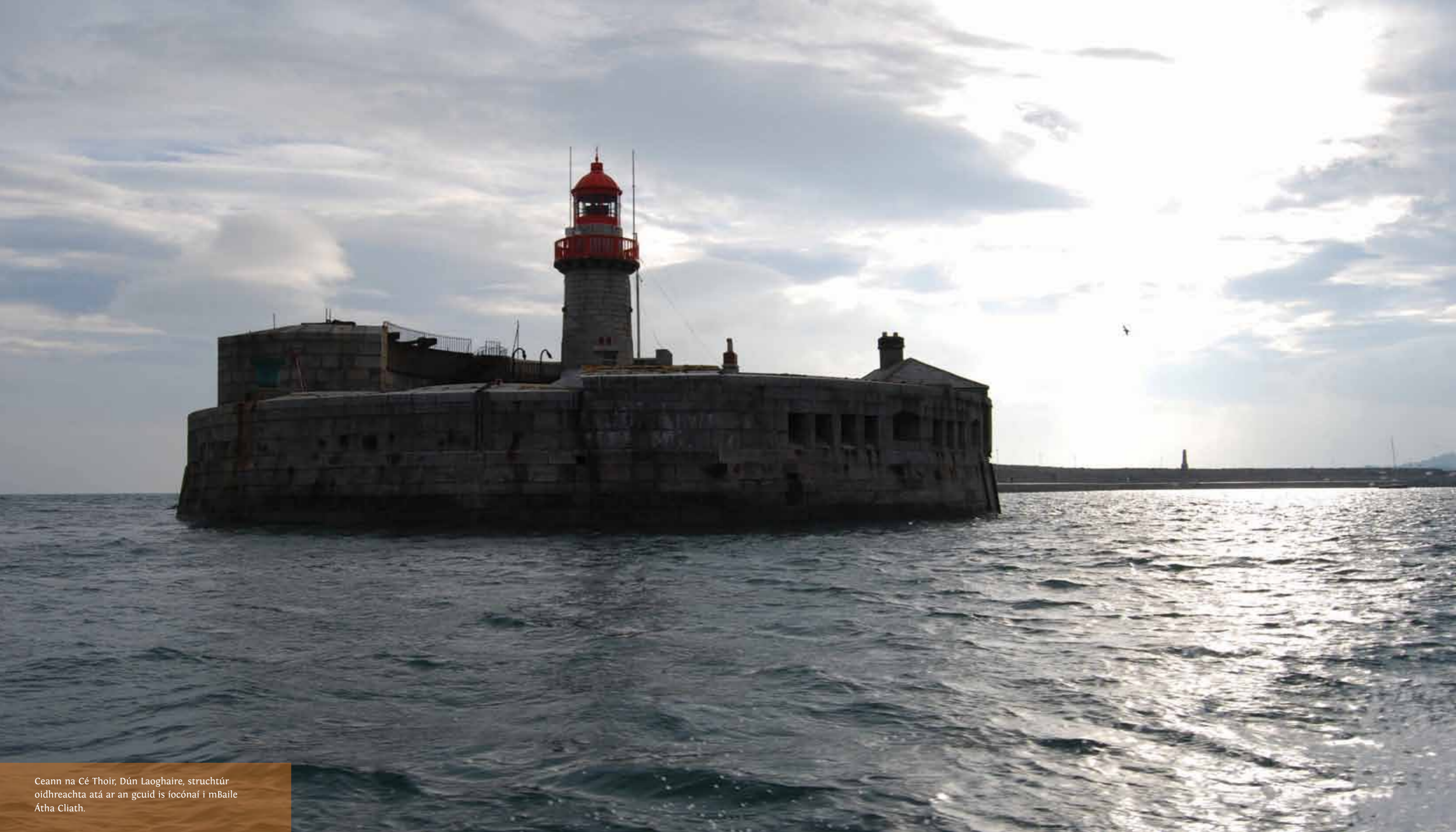
Ceann na Cé Thoir, Dún Laoghaire, struchtúr oidhreachta atá ar an gcuid is íocónaí i mBaile Átha Cliath.