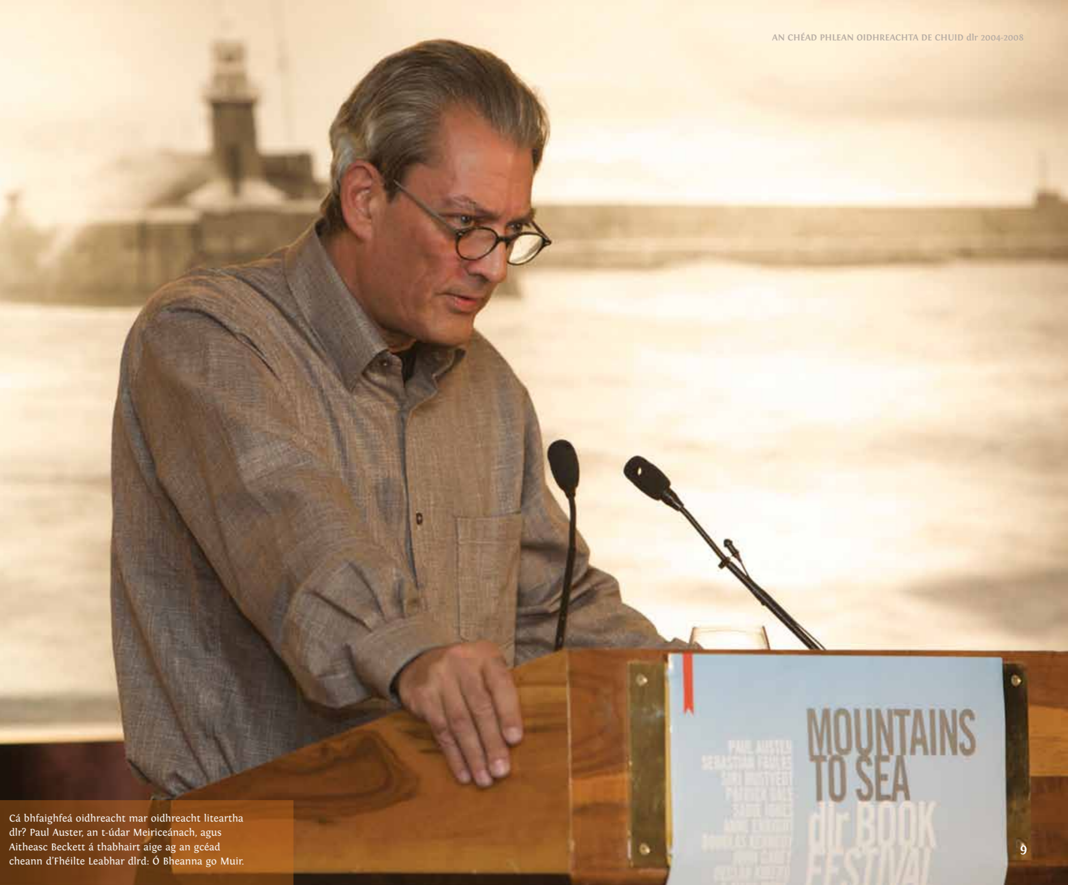
Cá bhfaighfeá oidhreachta mar oidhreachta liteartha dlr? Paul Auster, an t-údar Meiriceánach, agus Aitheasc Beckett á thabhairt aige ag an gcéad cheann d'Fhéilte Leabhar dlr: Ó Bheanna go Muir.

Nuair a bheidh Plean Oidhreachta dlr 2013-2019, Chun Leasa an Chaighdeáin Saoil, á chur i bhfeidhm táthar ag súil leis go gcuirfear leis na héachtaí a rinneadh de bharr an chéad Phlean agus go leanfar ar aghaidh ag caitheamh go tuisceanach le hoidhreachtaí an Chontae, agus go leanfar ag baint taitnimh aisti agus á cosaint