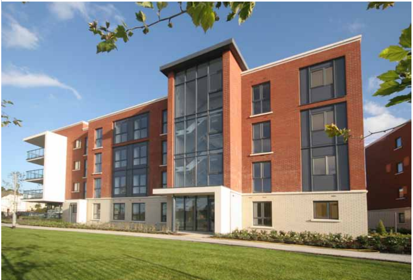
Tithíocht Shóisialta agus Inacmhainne, Páirc na Meala

Ainneoin gur thit an margadh tithíochta as a chéile rud nár tharla riamh roimhe, díoladh 27 teaghais incheannaithe i rith 2011. Toisc nár léiríodh an oiread sin spéise sa tithíocht incheannaithe cuireadh na haonaid incheannaithe go léir