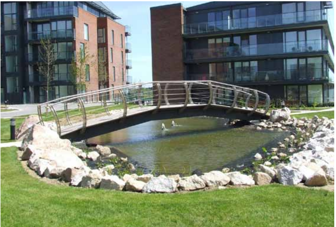
Tithíocht Inacmhainne – Levmoos & Míomósa

Rinneadh 914 measúnú réamhthionóntachta (seiceáil ar chúlra).