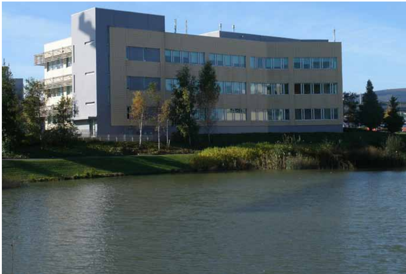
Páirc Eolaíochta & Teicneolaíochta Choill na Silíní