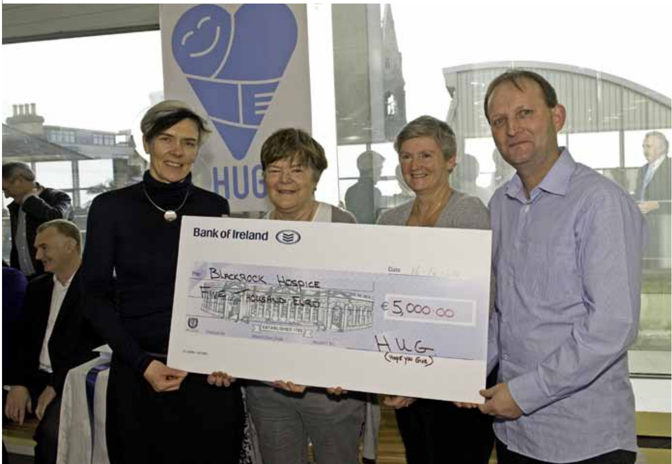
HUG ag bronnadh seic ar Ospis na Carraige Duibhe

Aithníonn an tOifigeach Leasa Foirne gábha neamhbhuana nó deacrachtaí pearsanta a bhíonn ag baill foirne más ag an obair nó sa bhaile é agus déileálann sé leo; soláthraíonn sé seirbhís rúnda chomhairleoireachta, atreoirithe agus eolais chomh maith.