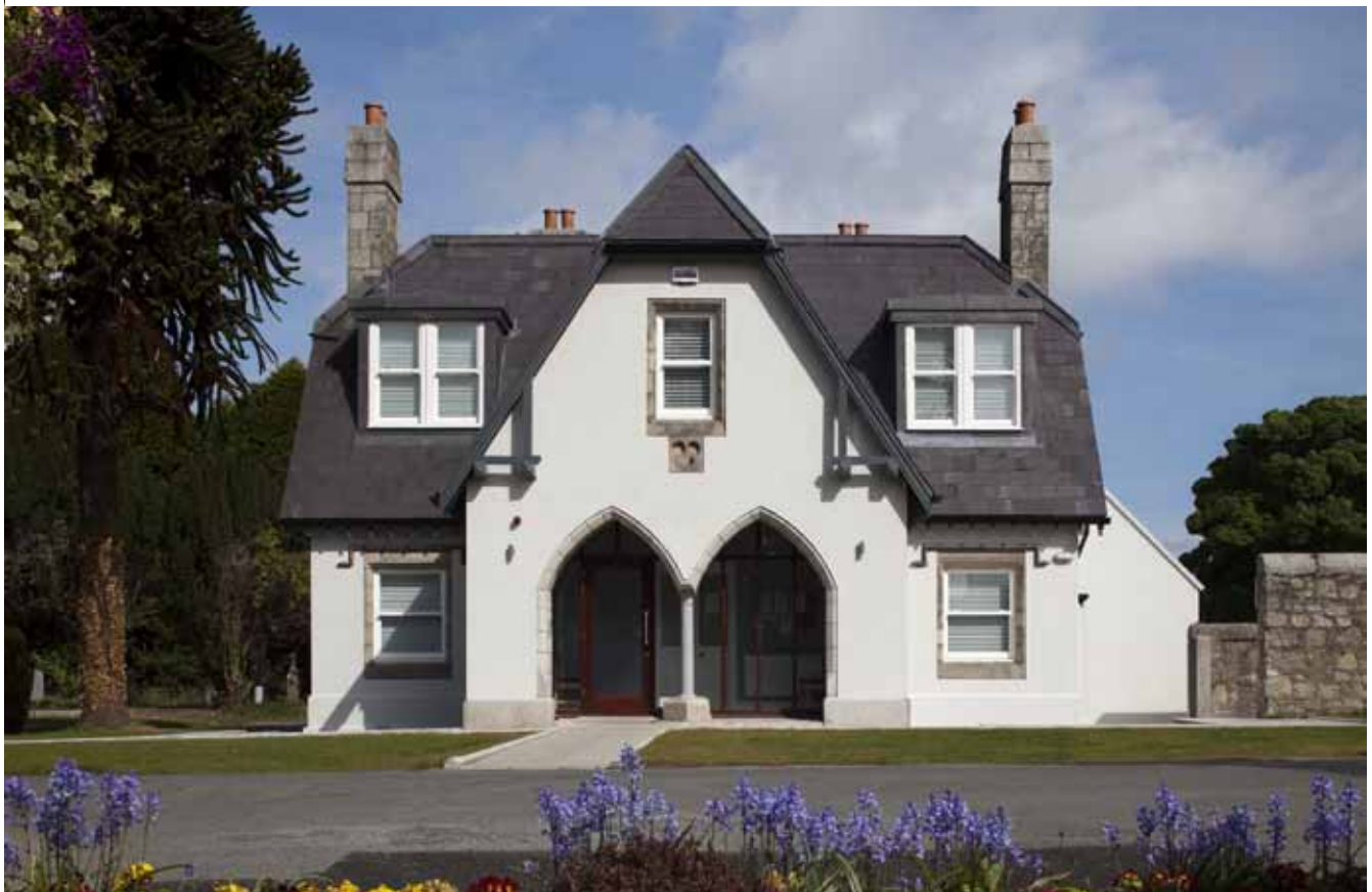
An Lóiste, Reilig Ghráinseach an Déin

Cuireadh tús le plean bainistíochta reiligi atá dúnta.