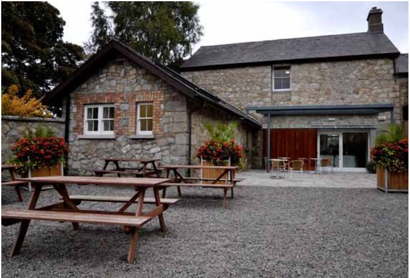
Na Seomraí Tae, Páirc Chábán tSile

Ba í an Rannóg a chistigh an Teach Oscailte agus a ghníomhaigh mar chomhordaitheoir air do Dhún Laoghaire-Ráth an Dúin ar dheireadh seachtaine an Tí Oscailte i nDeireadh Fómhair 2011 mar a raibh deis ag an bpobal cuairt a thabhairt ar thithe príobháideacha a bhí deartha ag ailtirí, ar fhoirgnimh stairiúla agus ar fhoirgnimh nua ar díol suntais iad.