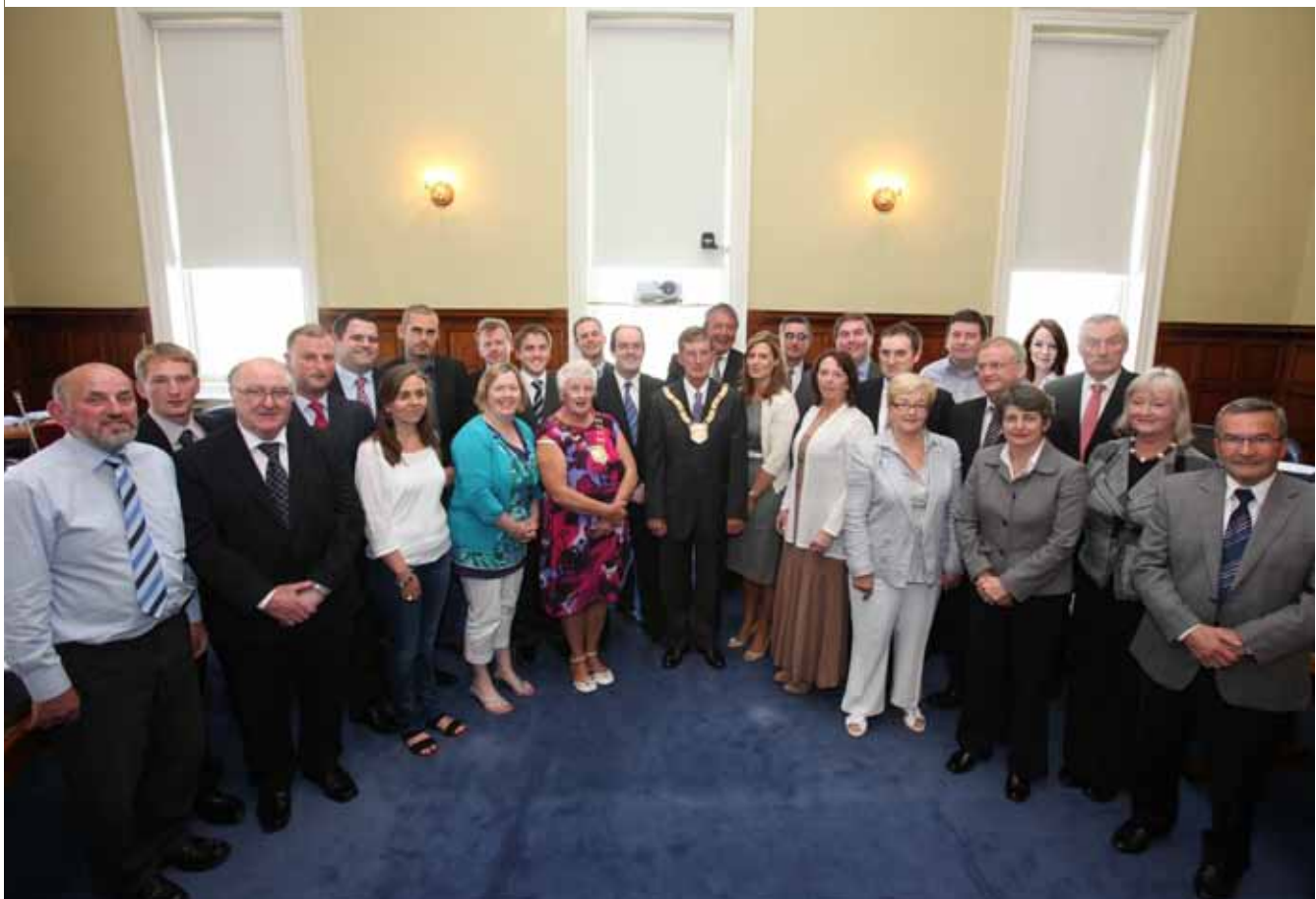
Comhaltai Tofa Chomhairle Contae Dhún Laoghaire-Ráth an Dúin

Is í an Oifig Cumarsáide atá freagrach as an gcumarsáid chorparáideach agus as an eolas corparáideach go léir a bhainistiú. Feidhmíonn an oifig mar lárphointe teagmhála don chaidreamh go léir leis na meáin agus tá ról leanúnach aici ó thaobh clú na Comhairle a bhainistiú trí phleanáil straitéiseach na cumarsáide. Áirítear ar cheann de phríomhchuspóirí na foirne a chinntiú gur trí phróiseas soiléir a dhéantar an chumarsáid ar an dá bhealach san eagraíocht le páirtithe leasmhara inmheánacha agus seachtracha araon.